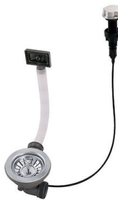
Vidange automatique 8407 000