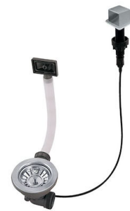
Vidange automatique LIRA 8407 103