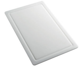
Planche de découpe en HPDE 8657 001